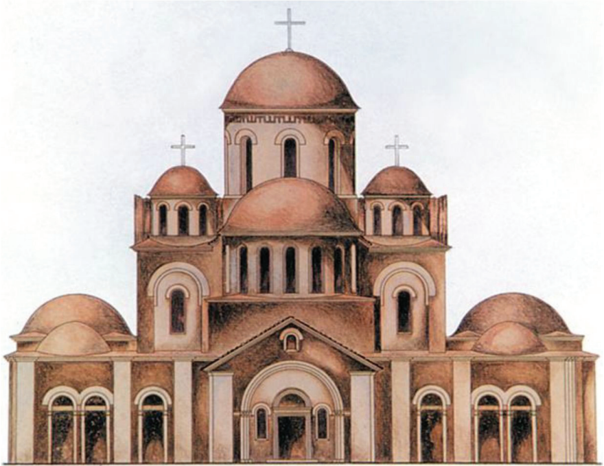
Десятинная церковь. Реконструкция Н. А. Холостенко

Князь Владимир был милостив и щедр к новообращенным христианам города Киева. В этот день он велел поставить на всех концах перевары 1 с медами и олом 2 , дать убогим людям хлеба, говядины.